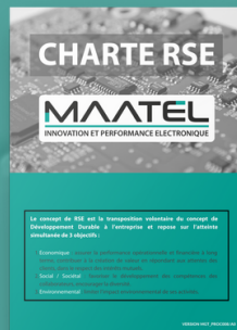
PROJET MENÉ PAR SABRINA TERRAT RESPONSABLE FINANCIÈRE & RH